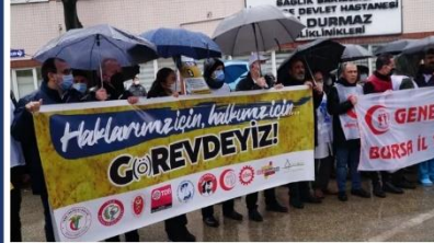
Bursa'da 7 hastanede hekimler ve sağlık çalışanları greve çıktı.

BURSA - Sağlık çalışanları ve hekimler daha önce başlattıkları eylem dizisini bugün itibarıyla bir günlük greve taşıdı. Türk Tabipler Birliği öncülüğünde iş bırakan sağlıkçıların ortak talebi sağlık sisteminin ve çalışma koşullarının iyileştirilmesi.